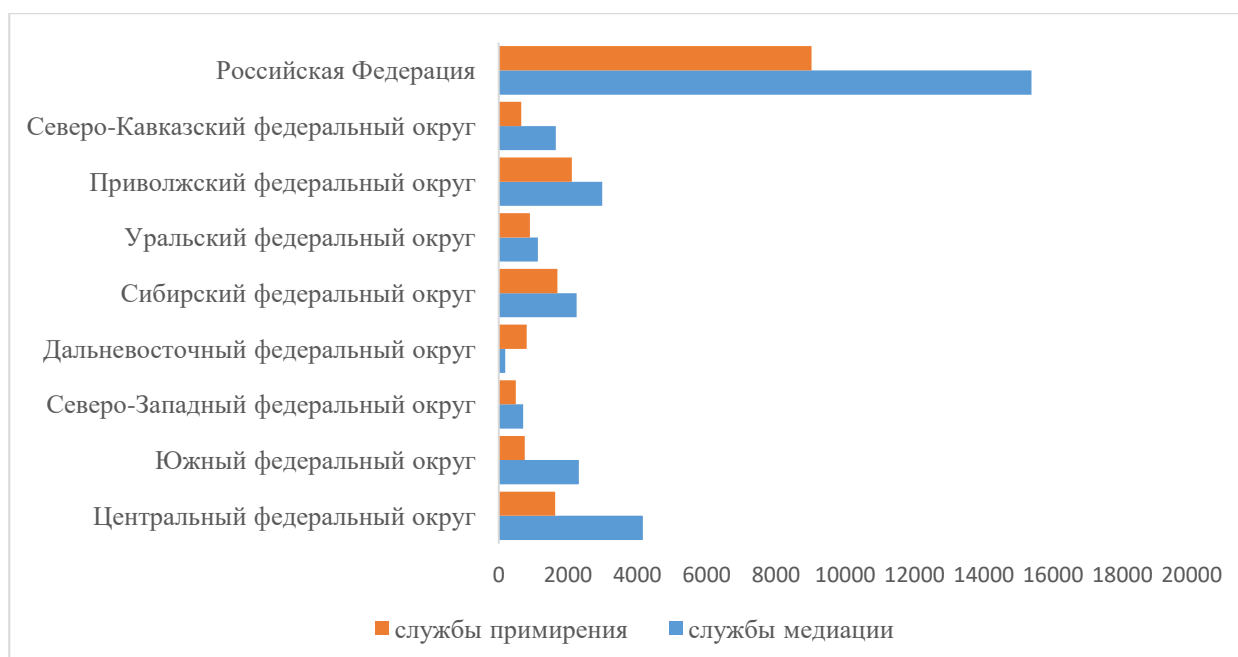
Рис. 1. Соотношение служб медиации и примирения в РФ и по федеральным округам в 2019/20 г.

Наибольшее число служб в целом по состоянию на 2019/20 г. сосредоточено в Центральном (5 911), Приволжском (5 175) и Сибирском (4 005) федеральных округах. По числу служб медиации лидируют Центральный (4 160), Приволжский (2 991) и Южный (2 330) федеральные округа, а по числу служб примирения – Приволжский (2 113), Сибирский (1 695) и Центральный федеральные (1 626) округа (табл. 1.1).